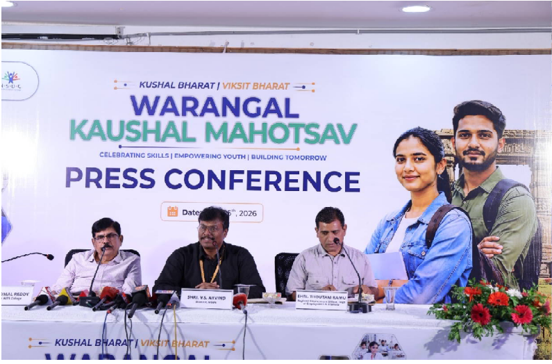
క్రైమ్ కౌంటర్ సూన్స్ జూన్ 25: తెలంగాణ యువతకు భారీగా ఉద్యోగ అవకాశాలు కల్పించే లక్ష్యంతో కేంద్ర నైపుణ్యాభివృద్ధి, వ్యవస్థాపకత మంత్రిత్వ శాఖ ఆధ్వర్యంలో ఈ నెల 27న వరంగల్లో 'కౌశల్ మహోత్సవ--2026' నిర్వహించనున్నారు. కాకతీయ ఇన్స్టిట్యూట్ ఆఫ్ టెక్నాలజీ అండ్ సైన్స్ (కిట్స్) ప్రాంగణంలో జరగనున్న